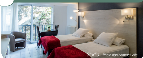
Studio - Photo non contractuelle