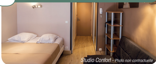
Studio Confort - Photo non contractuelle